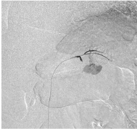
図2. 選択的左胃動脈造影 仮性動脈瘤からの造影剤の漏出あり。

退院となった。退院後、術後30日目に腹部CT施行し、仮性嚢胞はほぼ消失していた（図3-d）。