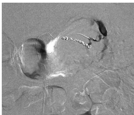
図4. 選択的左胃動脈造影 前回塞栓した動脈の近傍の血管より造影剤の漏出認め、再度、microcoilによる塞栓術施行した。