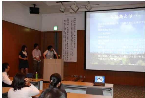
離島実習報告(与論島班)