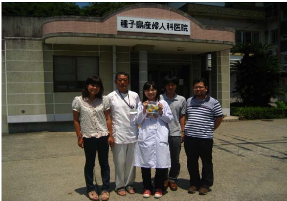
夏季離島実習(種子島コース)