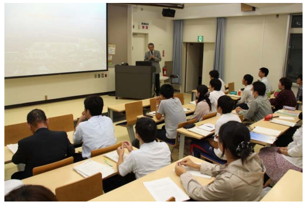
第7回鹿児島地域医療教育講演会