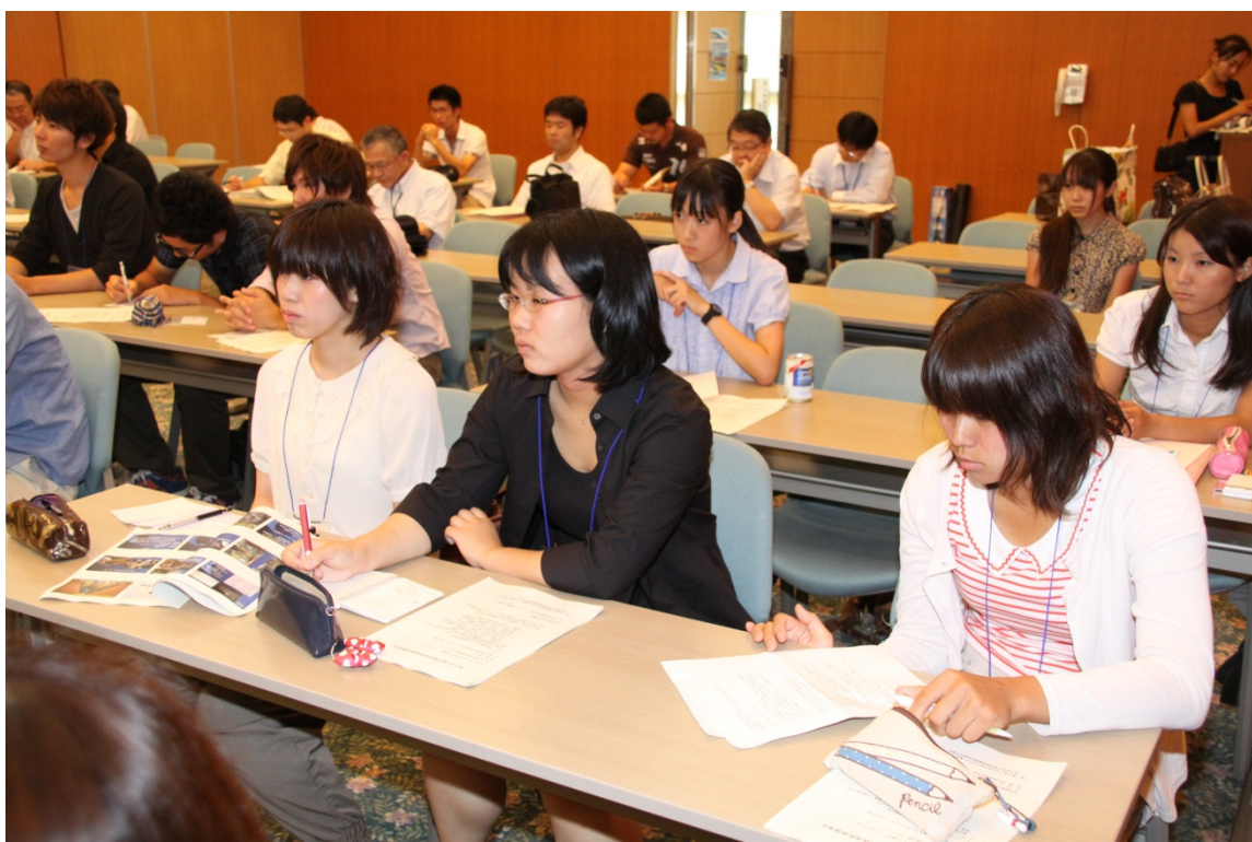
第6回鹿児島地域医療教育講演会の様子

地域医療における医師の役割は、その地域住民が必要としている保健・医療・福祉を幅広い視野に立って提供することです。そのために地域医療の現場に行き、体験を通じて自ら理解していくことが必要です。今後とも、地域推薦枠医学生達が地域医療に興味とやりがいを持てるように人材育成を行っていきたいと考えています。