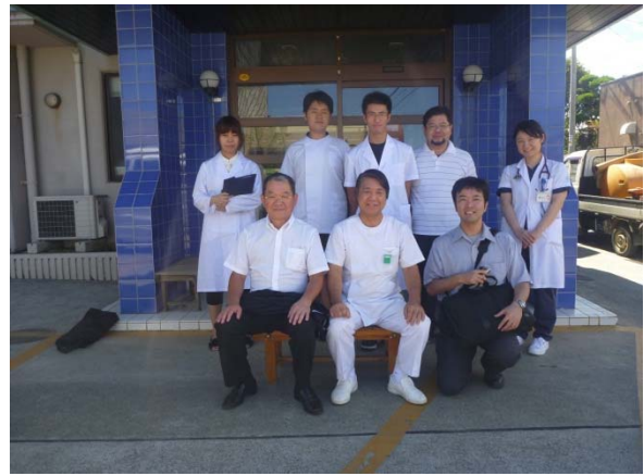
夏季離島実習(1・3・4年生)