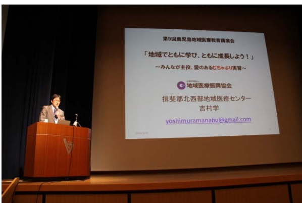
第9回鹿児島地域医療教育講演会